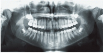
全体的に見ることができ（レントゲン写真）

全体の顎の骨の写真を撮影します。 歯は顎の骨に埋まっていますので、 支えている骨の減り具合がわかります。 また、噛む力がかかり過ぎているかもわかります。